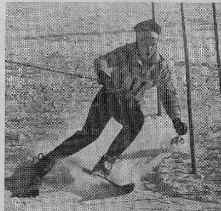
Lucille Wheeler, de Canadá, al ganar dos campeonatos mundiales al vencer en el gran slalom femenino en la competencia Alpina de esquies en Bad Gastein, Austria. El 16 de febrero Mis Wheeler se anotó su primera victoria al ganar la competencia cuesta abajo para damas.

GANAR DOS CAMPEONATOS FEMENINOS DE ESQUIES